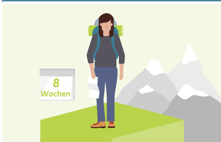
MeineGesundeReise (einzelne Person)